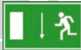
Fluchtweg nach unten