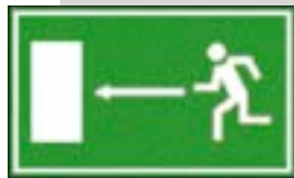
Fluchtweg nach links

Flucht- und Rettungswege zur Rettung von Personen sind fester Bestandteil der heutigen Brand- und Bausicherheit. Rettungswege müssen vorhanden sein. Jedes Gebäude mit Aufenthaltsräumen muss in jedem Geschoss über mindestens zwei voneinander unabhängigen Rettungswegen verfügen. Ein Rettungsweg muss über eine Treppe führen, der zweite kann mit Leitern der örtlichen Feuerwehr sichergestellt werden. Hinweisschilder zeigen im Brandfall den kürzesten Weg aus dem Gefahrengebiet. Diese Beschilderung ist im ganzen Bundesgebiet gleich.